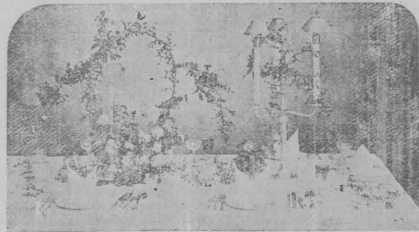
Διακόσμησις τραπέζης διὰ φυλλώματος

Τίθενται ἐπίσης, τοῦθ' ὅπερ εἶναι μάλιστα φελέκλων, καὶ ἐντὸς ἀθηροχῶν ἐν τῷ μέσῳ τῆς τραπέζης, κατὰ τὰς τέσσαρας γωνίας, ἐὰν ἦναι τετραγώνος, καὶ εἰς διάφορα ἄλλα σημεῖα, καθὼς ὁ χῶρος τὸ ἐπιτρέπει. Ἐννοεῖται δὲ κα ἀ τινὰ ἰδιότροπον σημαίν συσσωρευ ὡσιν εἰς τὸ μέσον τῆς τραπέζης πᾶλλας ἀνθιδόχας κυκλικῶς τὴν μὲν παρὰ τὴν