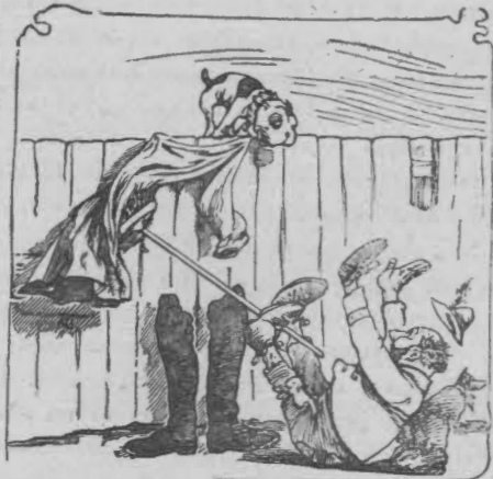
β') Πώς τὸ βρυχώμενον φάντασμα εξαφανίζεται δίδον χάρον εις πραγματικώτερον κίνδυνον.