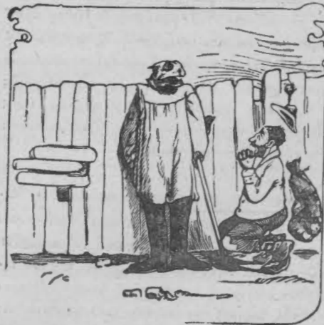
1) Ο τραγικός τρόμος του ληστού 'Αγριμούρη εις την θέαν ενός φάσματος. βρυχώμενου