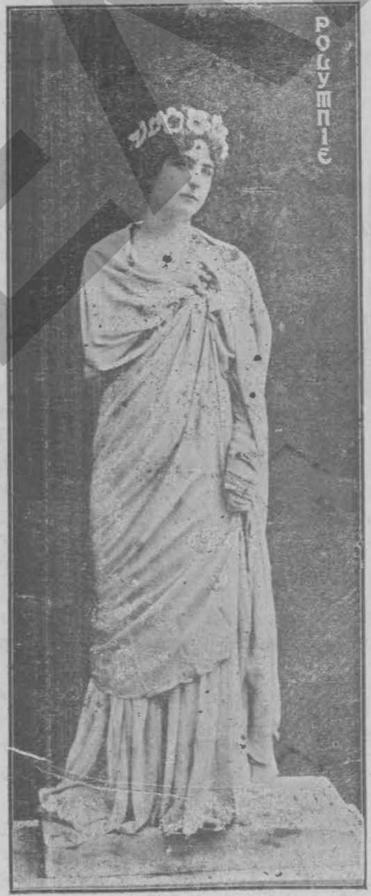
Ἡ ΜΟΥΣΑ ΠΟΛΥΜΝΙΑ

«Ὁ πόσοιμοι τὰς Χάριτας πταῖς Μοῦσαις συγκαταμῖγνός νῆ' Ἰσταν σι' Ἰσταν». ἔ.ρ. Ἡρ. Μαιν. Στ. 673—β.